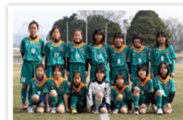
伊賀フットボールクラブ くノ一レディース