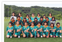
伊賀フットボールクラブ くノ一ユース